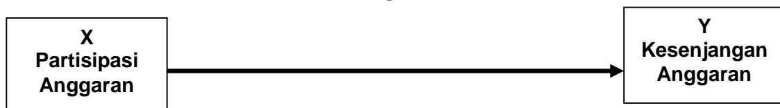
Gambar 2.1 Kerangka Pikir

Sesuai dengan teori dan hasil penelitian terdahulu yang sudah dikembangkan sebelumnya, maka peneliti menggambarkan kerangka pemikiran pada gambar berikut: 2.1